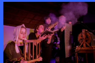
Even 4 eeuwen stof wegblazen, uche uche