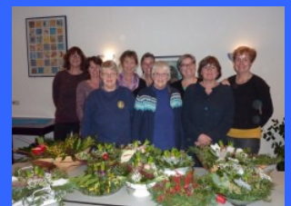
Deelnemers december 2014