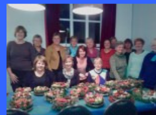
Deelnemers, dec. 2015

Deelname € 17,50, inclusief kerstmateriaal en groen. Aanvang 19.30 uur, zaal open 19.15 uur. Opgave bij Rita T442758 of mail info@dorpshuispieterburen.nl