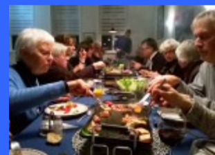
Gourmetavond, dec. 2015

De decembermaand is toch wel de maand van lekker eten en veel gezelligheid. Het dorpshuis doet hier graag aan mee. Dus staat er gourmetten op het menu. Vis, vlees en vegetarische lekkernijen staan deze avond voor u klaar. Doet u mee? Aanmelden kan tot 12 december, T442758 of info@dorpshuispieterburen.nl