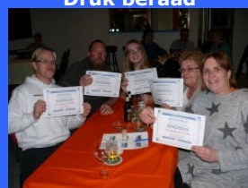
De vijf prijswinnaars