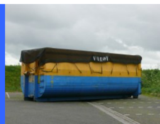
Papier hier, papier hier