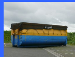
Papier hier, papier hier