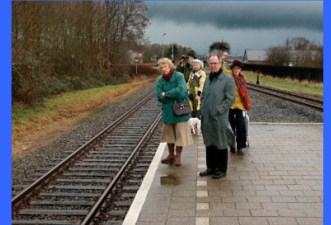
Mis deze voorstelling niet!

Klucht van Wim T. Schippers, opgevoerd door de Rederijderskamer Praedinius uit Winsum. Het verhaal speelt zich af in een treincoupé, waarin diverse mensen tegen wil en dank met elkaar en de conducteur geconfronteerd worden. De spelers nemen u mee op deze treinreis. Er ontstaat een communicatie die u als treinreiziger wel zult herkennen. De treinreis duurt ongeveer een uur en verveelt geen minuut. Een mooi herkenbaar en humoristisch stuk. Entree € 10. Kaarten zijn vanaf vandaag te bestellen in de Theatershop van www.dorpshuispieterburen.nl